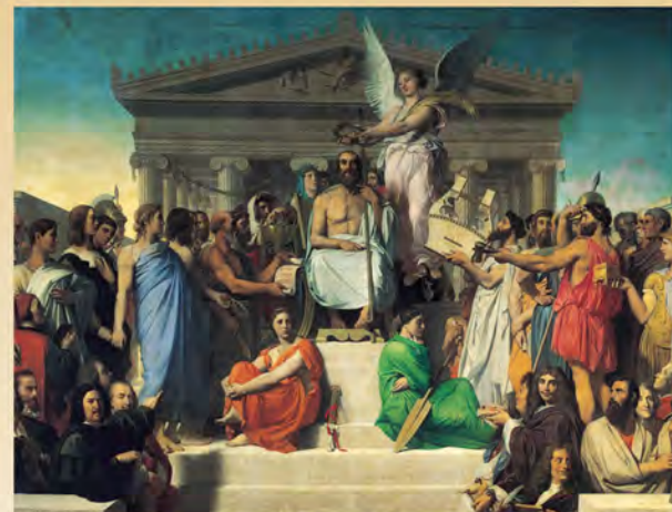
Jean-Auguste-Dominique Ingres : L'Apothéose d'Homère (1827), Musée du Louvre.

20-22 NOVEMBRE 2013 ENS DE LYON - SITE DESCARTES