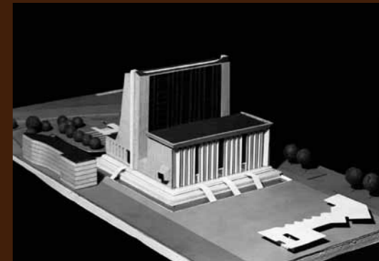
Maquette du projet de Palais de justice de Créteil, s. d. Arch. nat., 19850211/23.