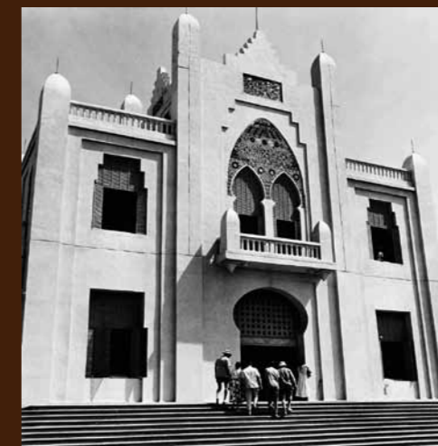
Palais du gouvernement à Niamey, Niger. Arch. nat., 20000335/41.