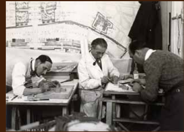
H. Baranger, Création d'une maquette du Palais de Chaillot pour l'exposition internationale de Paris, 1937. Arch. nat., F/12/12114.

16h30 Conclusion , par Charlotte LEBLANC, chargée d'études documentaires, Archives nationales, doctorante à l'École pratique des hautes études