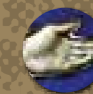
Engrain Le Prince, Arbre de Jessé (détail), vers 1525, vitrail de l'église Saint-Etienne à Beauvais.