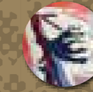
Marc Saint-Saëns et Gisèle Brivet, Dédalo et Icare (détail), 1971, tapisserie de l'Université de Clermont-Ferrand.