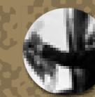
Henri Bellery-Desfontaine, Le vitrail , 1905, panneau peint pour la frise du salon français des industries d'art moderne à l'Exposition universelle de Liège, représentant Félix Gaudin dans son atelier, choisissant un verre pour un panneau en cours de restauration, encadré par deux verrières dessinées de Félix Gaudin et Eugène Grasset.