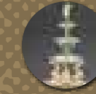
Thomas Kirkby (dessin), Pierre-Émile Jeannest (modelage), Herbert Minton (manufacture), Surbot de table , 1851, porcelaine tendre, Victoria & Albert Museum.