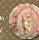
Putto (détail), XIX e siècle, garniture de siège, collection privée. Toile imprimée à la planche de cuivre, dans le genre de la toile de Jouy.