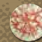
Cage aux colombes (détail), XIX e siècle, garniture de siège, collection privée. Toile imprimée à la planche de cuivre, dans le genre de la toile de Jouy.