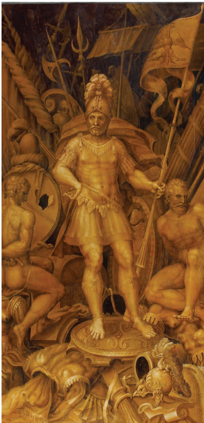
Château d'Ancy-le-Franc, galerie de Pharsale, mur nord, soldat debout sur un bouclier, détail