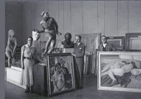
Rose Valland au Jeu de Paume (1935)