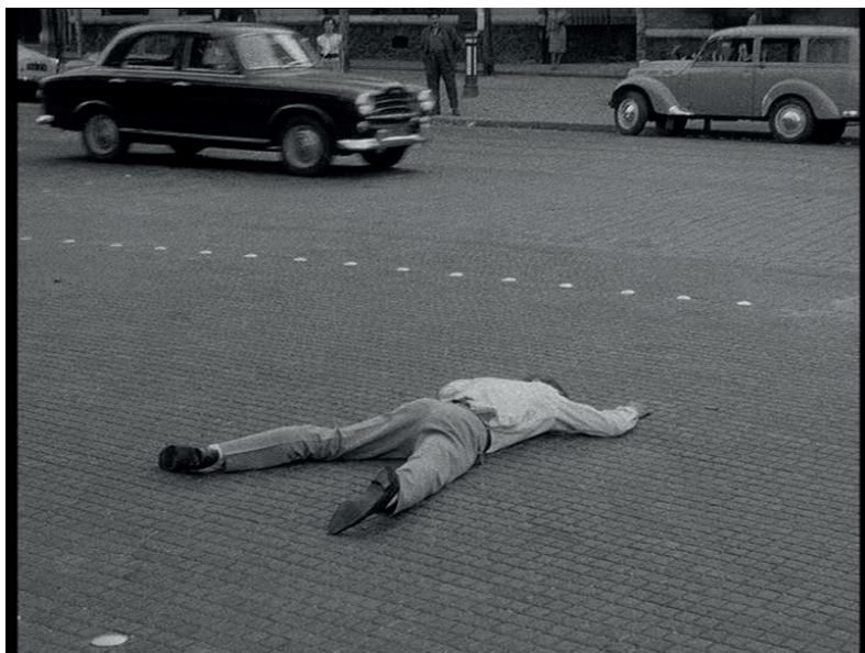
Fig. 3. Jean-Luc Godard, À bout de souffle , 1960, photogramme © Studiocanal Image.