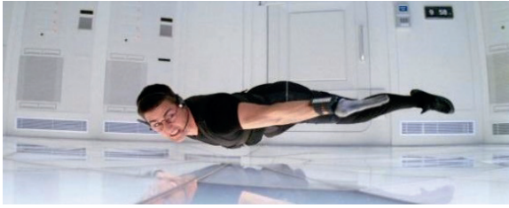
Fig. 8. Mission Impossible , Brian de Palma, 1996, photogramme © Paramount Picture.

Avec son saut sans chute, l'artiste manifeste une jouissance des puissances de l'image mécanique, l'impertinence de refuser de clore l'histoire tout autant que la vie. C'est la conscience de cette liberté de la représentation photographique qui donne à Klein l'impulsion de sauter, la légèreté extatique de son suicide simulé. Klein se jette dans l'espace de la représentation, et sa position tendue vers le ciel, sa manière de se lancer dans le vide de tout son corps, a quelque chose de joyeux, de beaucoup plus joyeux que suicidaire. Dans son ouvrage La Peinture comme crime , Régis Michel décrit son corps d'« homme-pinceau » tendu vers le haut comme un motif freudien, forme qu'il associe à l'interprétation du rêve de vol : un rêve érectile, qui supprime la pesanteur. Son plaisir manifeste face à la farce qu'il est en train de monter témoigne de sa jouissance de la création artistique, de l'image et de la vie en général 27 .