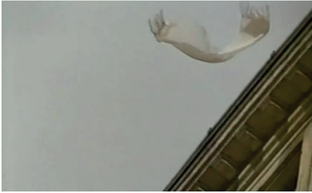
Fig. 6. Robert Bresson, Après le suicide : flottement, Une femme douce , 1969, photogramme © Cinémathèque française.

un spectre, au sens donné par Jacques Derrida : « le spectral est une trace qui marque d'avance le présent de son absence 21 », une hantise de la disparition et de la réapparition fantômale par la photographie. Ou par le cinéma. Car la spectralité hante particulièrement les images reproductibles, traces d'un référent menacé de disparition au moment même de sa captation 22 .