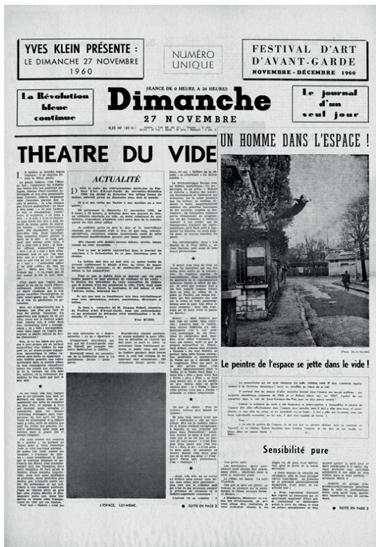
Fig. 1. Yves Klein, Dimanche 27 novembre 1960 (Le journal d'un seul jour) , 1960, Impression typographique recto-verso en noir, feuillet double, 55,5 x 38 cm © Yves Klein, ADAGP, Paris, 2016.