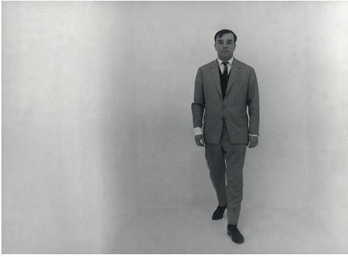
Fig. 7. Yves Klein dans la salle dédiée au « Vide » durant l'exposition «Yves Klein Monochrome und Feuer », Museum Haus Lange, Krefeld, Allemagne, 14 janvier - 26 février 1961. Action artistique d'Yves Klein. © Yves Klein, ADAGP, Paris, 2016.