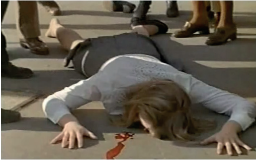
Fig. 5. Robert Bresson, Le suicide, Une femme douce , 1969, photogramme © Cinémathèque française.

comprend qui est l'auteur du simulacre qui l'a abusé et du crime qui se cache derrière. Il refuse l'image illusoire pour la préférer comme source de connaissance. Il met fin à son désir insatiable, vertigineux. La chute jusqu'ici suspendue devient effective à la fin du film. Judy meurt cette fois-ci en s'écrasant dans un vide sans croyance. Un vide vidé par le règne du visible, selon l'expression utilisée par Jean-Yves Jouannais pour décrire le saut dérisoire d'Yves Klein 17 . Le vide n'est plus rempli de croyances et de mystères venus amortir la chute.