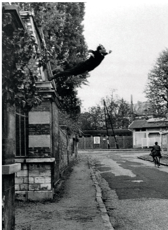
Fig. 2. Yves Klein, Le Saut dans le vide , 5, rue Gentil-Bernard, Fontenay-aux-Roses, 1960. Le titre de cette œuvre d'Yves Klein d'après son journal « Dimanche 27 novembre 1960 », est : « Un homme dans l'espace ! Le peintre de l'espace se jette dans le vide ! », 1960. Action artistique d'Yves Klein. © Yves Klein, ADAGP, Paris, 2016. Collaboration Harry Shunk et Janos Kender © J.Paul Getty Trust. The Getty Research Institute, Los Angeles.