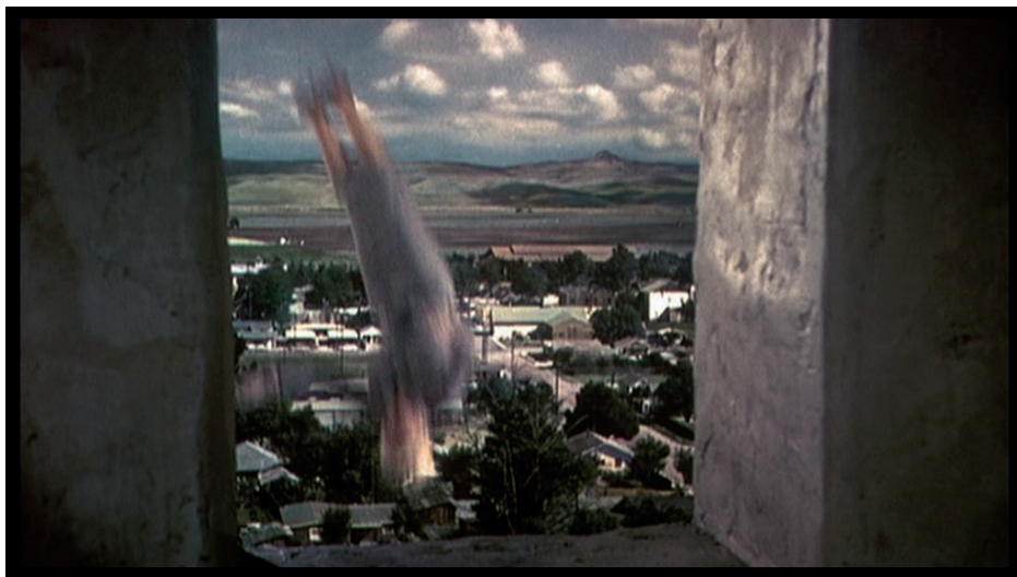
Fig. 4. Alfred Hitchcock, Sueurs Froides , 1958, photogramme.