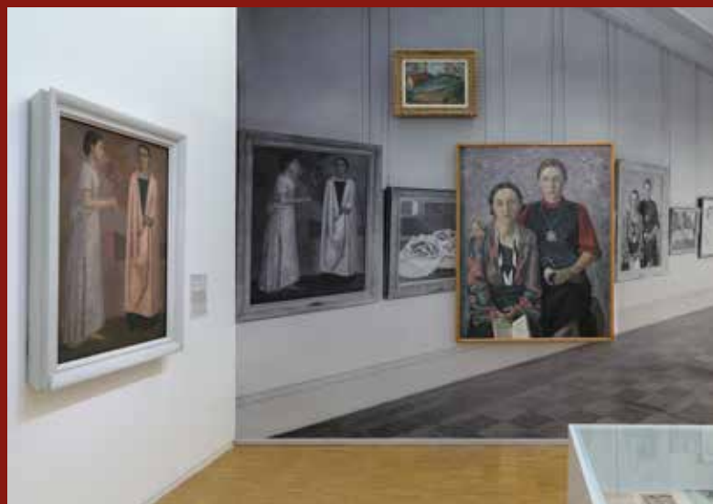
Vue de l'exposition Histoire(s) d'une collection , Centre Pompidou, 2018