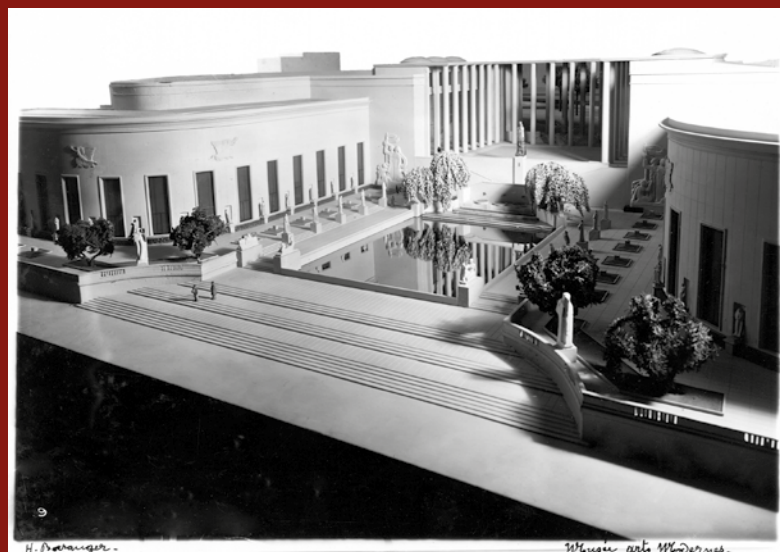
Maquette schématique du projet de Musée des arts modernes (Palais de Tokyo), 1937. 19850024/157

La célébration du bicentenaire de la création du premier musée d'art contemporain au palais du Luxembourg en 1818 est l'occasion d'établir un bilan historiographique de l'institution et des problématiques que continue de soulever l'exposition d'un art « contemporain », dans une perspective transnationale et interdisciplinaire. Il s'agit donc de porter un regard rétrospectif et réflexif sur le positionnement des musées publics et privés, passés et actuels, face à l'art de leur temps.