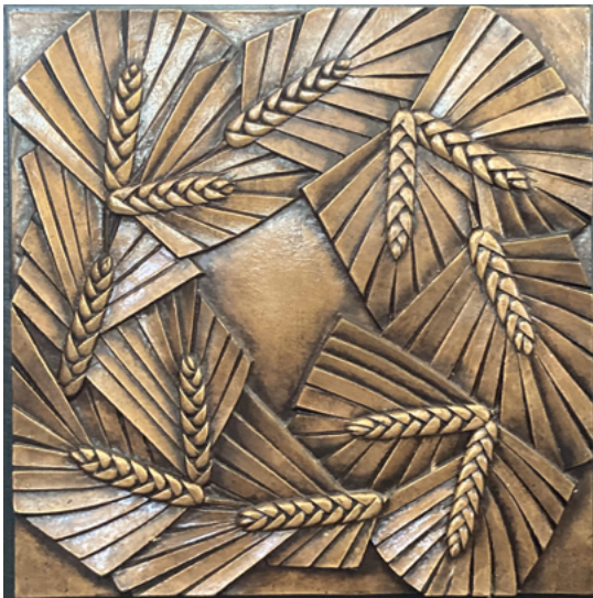
Raymond Subes, détail d'un banc de communion, cathédrale Notre-Dame-et-Saint-Vaast, Arras